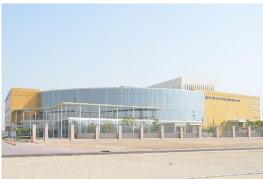
Abu Dhabi Polytechnic