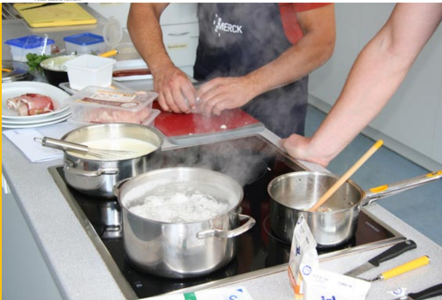
Chef mit Schürze: Im Kochseminar lernen Führungskräfte aus den Chemie-Werken von Merck, was Projektmanagement bedeutet.

Preview: ► Kochen für die Kompetenz: Wissen geht durch den Magen ► Veredelte Rohstoffe: Die Küche als Projekt-Metapher ► Kumpelhafte Chefs: Schichtführer in der Zwickmühle ► Problematischer Tunnel: Auch Praktiker brauchen Planung ► Durchgereichte Verantwortung: Management-Skills auf Schicht ► Überzeugende Überforderung: Wie Macher zu Fragern werden ► Angestoßene Entwicklung: Der lange Weg an den Tellerrand