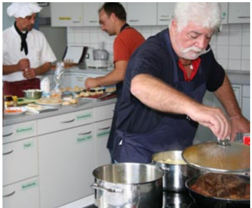
Anleiten und Einteilen: In der Küche muss jeder wissen, was er zu tun hat. Kochen im großen Stil ist eine Frage der Arbeitsteilung.

Das wurde bereits gestern, am Vortag des Gala-Bufferets, deutlich: Beim ersten gemeinsamen Probe-Kochen legen die Küchennovizen nach Gutdünken los, nach Rezepten fragt keiner, Abstimmung findet allenfalls ansatzweise statt. Jeder wurschtelt einfach vor sich hin.